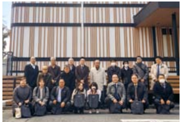
日程：2025年2月20日(木) 参加：11社 20名

創業の精神である代田イズム、「予防医学」「健腸長寿」「誰もが手に入られる価格で」をテーマに説明を受けました。世界各地で活躍するヤクルトレディの販売紹介もあり、工場で作られた商品の試飲や工場見学もおこなわれました。