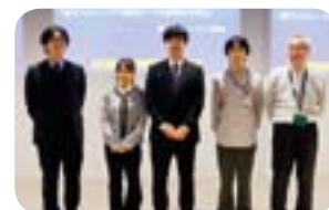
量子コンピューティング部会

観光地 15 か所を最短ルートで回る計算を量子コンピューターで実施し、その高速処理能力を実証しました。従来のコンピューターでは数カ月かかる計算が、量子コンピューターでは短時間で完了します。これにより、高速な計算と最適化という量子コンピューターの強みがわかりやすく示されました。技術は現在、まだ黎明期にありますが、将来的には不可欠な存在となる可能性があります。また、今後の人材育成の重要性も強調されました。