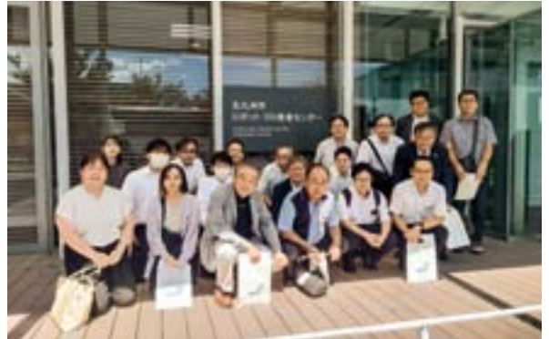
日程：2024年9月12日(木) 参加：10社 20名

ゼンリンミュージアムでは、ゼンリンの創業地である別府についての特別展が開催されており、別府市が観光都市へと発展した過程についての説明を、参加者された皆さんは真剣に聞いていました。